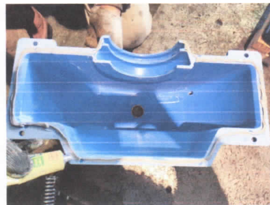
图 6 密封胶涂抹连续均匀

检查完成后，按上述步骤逆序进行复原，复原时 请注意：在箱体或箱盖结合面上涂抹密封胶时，应形成一个均匀连续的环，否则会造成驱动主机润滑油渗漏。 密封胶型号为 HZ-1213B。