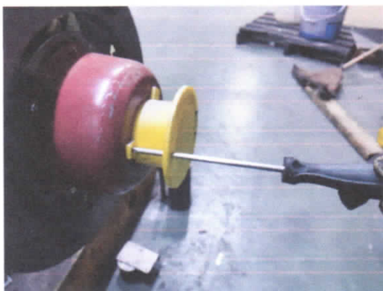
图 3 拆除电动机尾轴防护罩

用 PH1 或 PH2 十字螺丝刀拆除电动机尾轴防护罩，将固定螺钉和防护罩放置好，如图 3 所示。装上盘车手轮同时手动打开制动器，盘动电机轴，使用力矩扳手和 24#梅花扳手对蜗轮联接螺栓逐个检查，如图 4，图 5 所示。其力矩值应符合表 1。对已出现松动的螺栓组，应进行预紧或更换，预紧后其力矩值符合表 1。