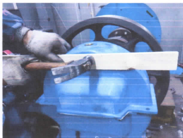
图 2 拆除箱盖

使用木板或胶板贴在箱盖上, 用锤子均匀敲击木板, 使箱盖松动, 取下箱盖。如图 2 所示。去除箱体和箱盖结合面上的密封胶, 注意不要让密封胶残渣掉落到箱体内的润滑油中。