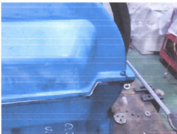
图 1 拆除箱盖固定螺钉

使用 6 号内六角扳手将固定驱动主机箱盖的螺钉取出, 放置好, 如图 1 所示。